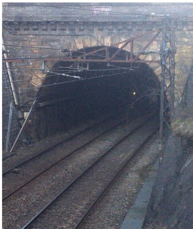
L'entrée nord du tunnel de Roques

Aujourd'hui c'est un village, calme, paisible où il fait bon vivre.